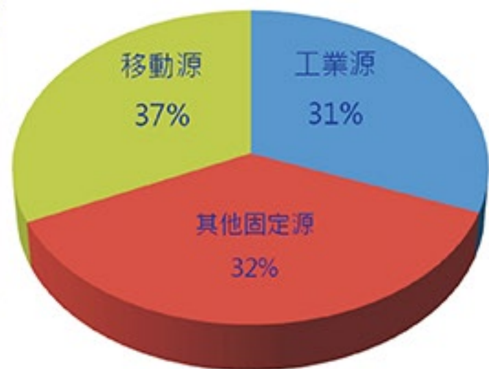
國內各類汙染源對懸浮微粒(PM2.5)濃度影響比率