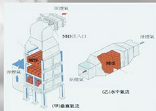
SCR/SNCR 選擇性脫硝觸媒還原反應設備 (又稱：煙氣脫硝技術)

目前針對固定污染源主要有三種可行的控制方案，分別是：選擇性脫硝觸媒還原反應器 (SCR/SNCR)、靜電集塵器 (EP)、排煙脫硫系統 (FGD)。其中， 選擇性脫硝觸媒還原反應器 (又稱煙氣脫硝技術) ，為全球空污防制上所採用之最佳可行技術之一，是公認能夠高效率處理「氮氧化物」(NO x ) 的最有效方法。SCR/SNCR 系統穩定性高且技術純熟，全世界已有數百座 SCR/SNCR 工廠在運轉。在台灣也有超過五十座以上具有 SCR/SNCR 設備的廠房正在運轉或興建。環保署更持續進行污染源管制，並推行空污防制費減免措施，使得加裝 SCR/SNCR 的工廠更顯其價值。