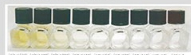
AdBlue Plus經過超奈米過濾，色度更精純

提升100倍過濾效能，過濾粒徑高達0.01微米，確保產出的AdBlue色度更為精純，同時大幅延長產品保存期限，保護小轎車精密零件。對於無暇及時回廠保養的小轎車車主而言，AdBlue Plus無疑柴油轎車的最佳選擇。